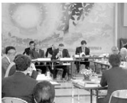
▲第5回議会の議員及び農業委員会の委員の任期等検討小委員会の様子